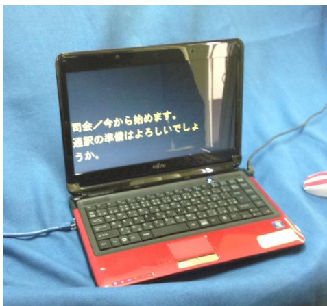
パソコン要約筆記