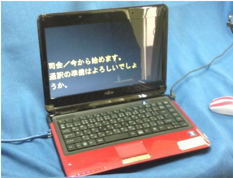
パソコン要約筆記

盲ろう者に視力が残っている場合、盲ろう者の見やすい大きさ、太さ、色の文字を書いて伝えます。